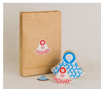
Рис. 1 Волга Игорка