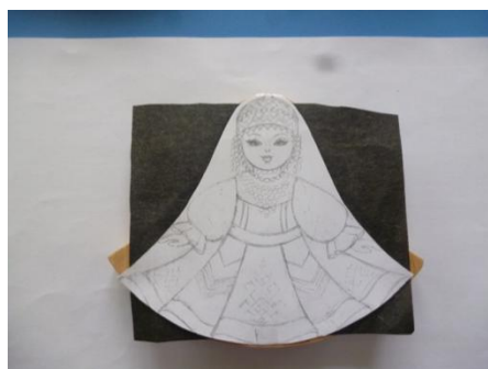
Рис. 7 Шаг 3.

Далее эскизы раскрашиваются, эти рисунки будут образцами наших будущих сувениров.