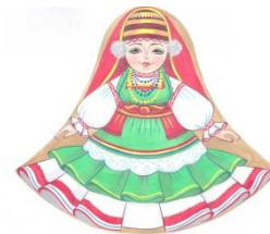
Рис. 6 Мордовский костюм

Далее эскизы раскрашиваются, эти рисунки будут образцами наших будущих сувениров.