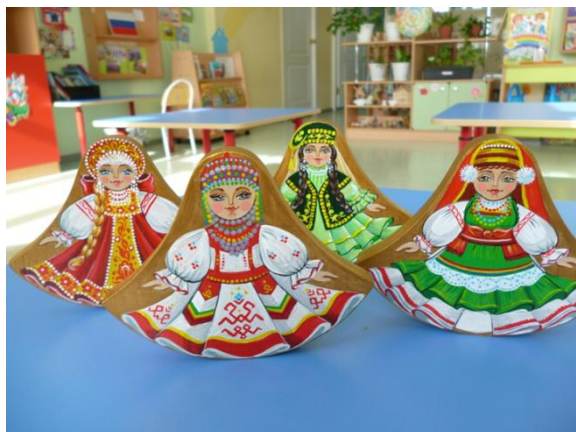
Рис.9 Игрушки-сувениры «Куколки-качалки»

Ну, вот и все! Наслаждаемся результатом (рис.9, рис.10) и используем по назначению.