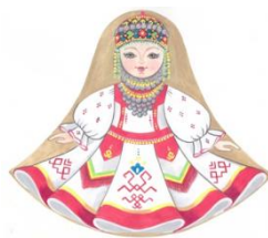
Рис. 5 Чувашский костюм