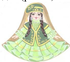
Рис. 4 Татарский костюм