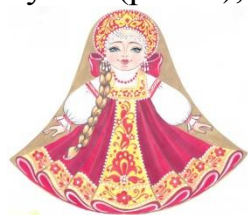
Рис. 3 Русский костюм

На этом шаге можно нарисовать эскиз на самой деревянной заготовке самим или перевести рисунок с готовой картинки. Поскольку перед нами стоит задача создать кукол в национальных костюмах – варианты эскизов необходимо разработать предварительно на основе национальных костюмов народов Среднего Поволжья: русских (рис.3), татар (рис.4), чуваш (рис. 5), мордва (рис. 6).