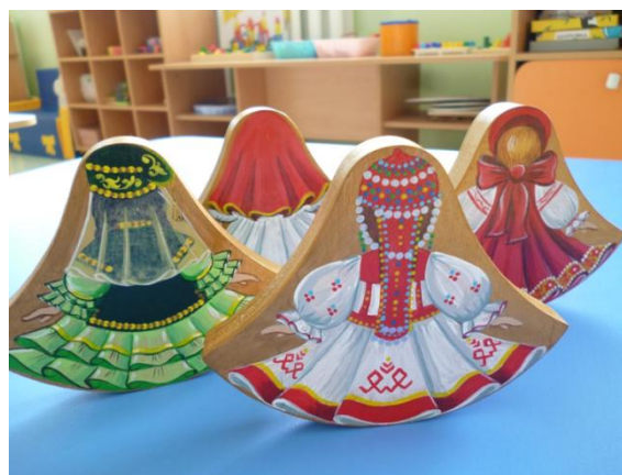
Рис. 10 Игрушки-сувениры «Куколки-качалки»