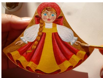
Рис. 8 Шаг 4

Начинаем с росписи самого главного - лица. Затем начинается самая интересная часть работы – это роспись наряда куколки.